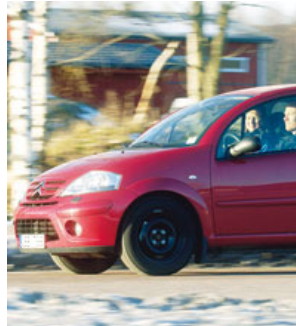
Familjen Hylén i Falun sparar pengar och miljö genom medlemskapet i bilpoolen.

– Folk kommer att vänja sig vid att bilen inte står precis utanför dörren.